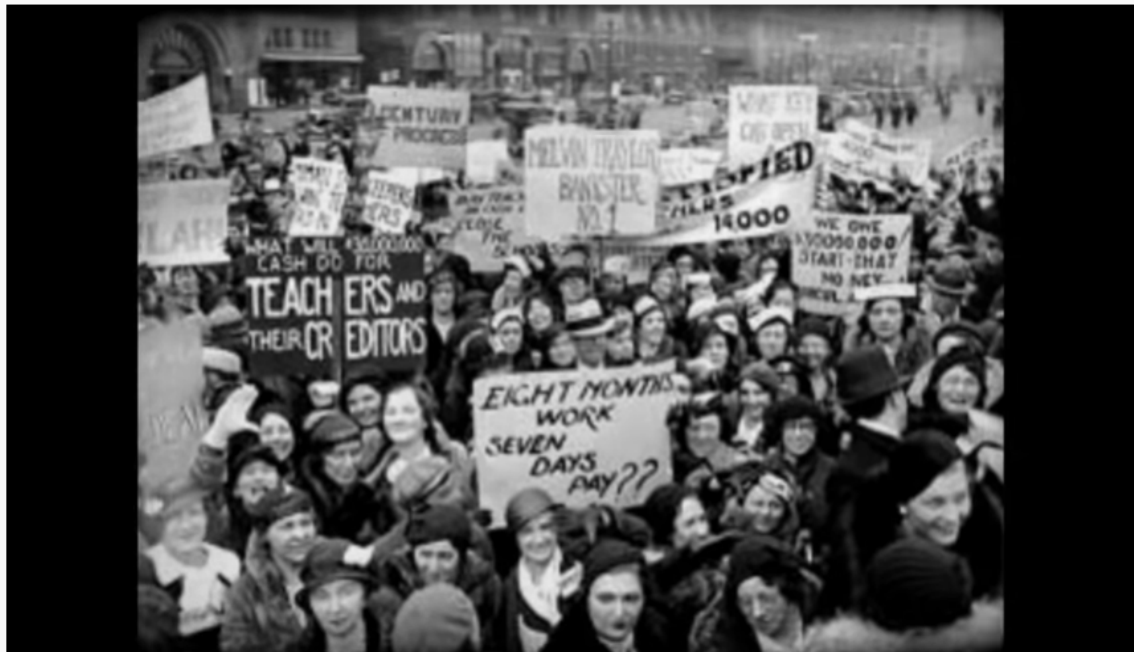
Reportagem especial: Evolução do Trabalho